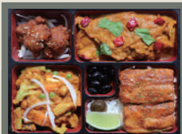
盛宴 NT$ 380/份 卡拉瑪雞肉咖哩餐 附 可樂一瓶