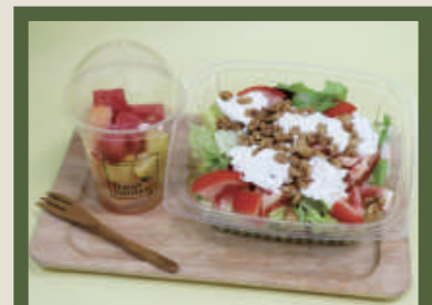
輕食沙拉餐 NT$ 280/份 雞肉凱薩沙拉或番茄瑞可達乳酪沙拉 附季節水果杯、蘋果汁