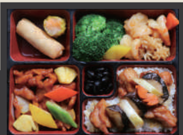
采悅百匯餐 NT$ 480/份 附 西施海皇豆腐羹