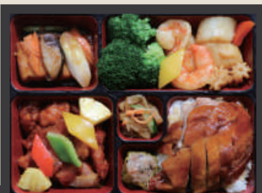
采悅經典餐 NT$ 680/份 附 竹筴北菇燉雞湯