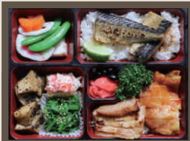
迎月鯖花魚餐 NT$ 380/份 附 味增湯或飲料