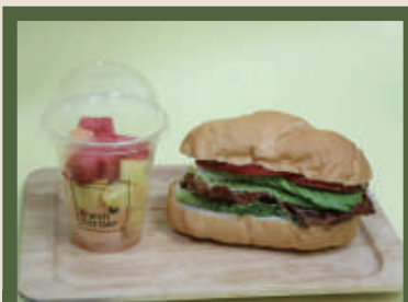
B.L.T 三明治餐 NT$ 250/份 B.L.T三明治 季節水果杯、蘋果汁