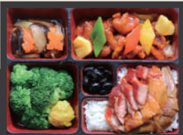
采悅三寶餐 NT$ 380/份 附 飲料一瓶