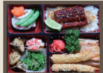
迎月鰻魚炸蝦餐 NT$ 580/份 附 味增湯或飲料